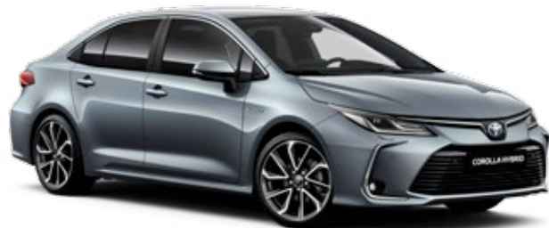
1K3 Небесно синьо