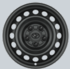
15" стоманени джанти с тасове