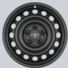
16" стоманени джанти с тасове