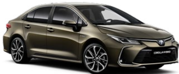
6X1 Патиниран бронз*