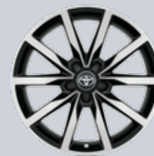
18" фрезовани алуминиеви джанти, частично черни (5 двойни лъча)