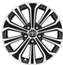
17" алуминиеви джанти в два цвята – на фрезован алуминий и черно (10 лъча)* Стандартни за Luxury