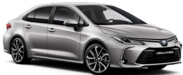
1K0 Течен метал