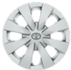
15" стоманени джанти с тасове (8 лъча) Стандартни за Comfort