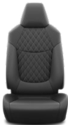
Частично кожена черна тапицерия с бежови шевове Стандартна за Luxury, Luxury +