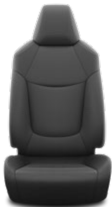
Черна текстилна тапицерия Стандартна за Comfort