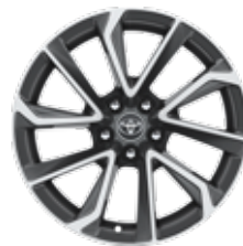
18" алуминиеви джанти в два цвята – на фрезован алуминий и сив (5 лъча) § Стандартни за Luxury +