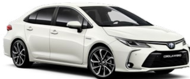
070 Перлено бял §