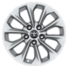
16" алуминиеви джанти (10 лъча) Стандартни за Executive, Executive +