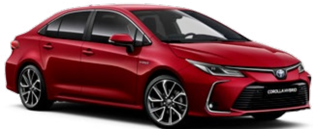
3U5 Огнено червено §