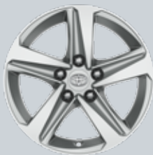
16" алуминиеви джанти (5 лъча)