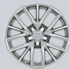
17" сребристи алуминиеви джанти (5 тройни лъча)