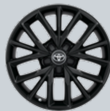
17" алуминиеви джанти (5 тройни лъча)