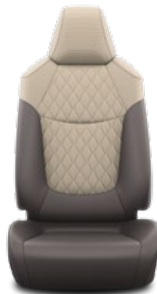
Тъмнокафява частично кожена тапицерия с бежови шевове Стандартна за Luxury, Luxury +