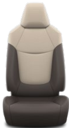
Тъмнокафява текстилна тапицерия с бежови вложки Стандартна за Comfort